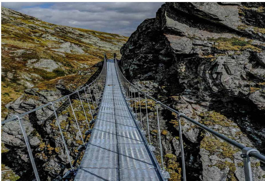
Während der Montage: Die speziellen Lochungen in den Blechprofilrosten gewähren ein gutes Abfließen des Meteorwassers und mit der Rutschfestigkeit Klasse R13 höchste Sicherheit.